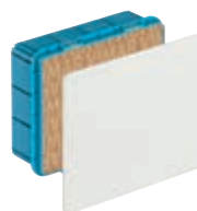
Scatola derivazione incasso