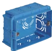
Scatola da incasso 3 moduli